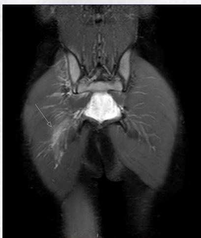
RM con contraste

La piomiositis suele ser patología típica en adultos con enfermedades crónicas e inmunosupresión y originariamente descrita en climas templados . Este caso refleja la necesidad de un alto índice de sospecha ante cojera súbita en un niño.