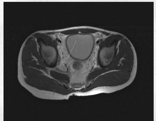
RM con contraste

Se decide ingreso para antibioterapia IV ( Cloxacilina y Cefotaxima ) y completar pruebas diagnósticas. En RM con contraste se observa captación a nivel musculatura ilio-psoas, obturador y glúteo derecho . A las 48 horas cede la fiebre y notable mejoría del dolor. Al alta analítica con normalización leucocitosis . Seguimiento a las 2 semanas con mejoría completa del dolor, a los dos meses completamente asintomático y a los 6 meses es dado de alta con completa resolución.