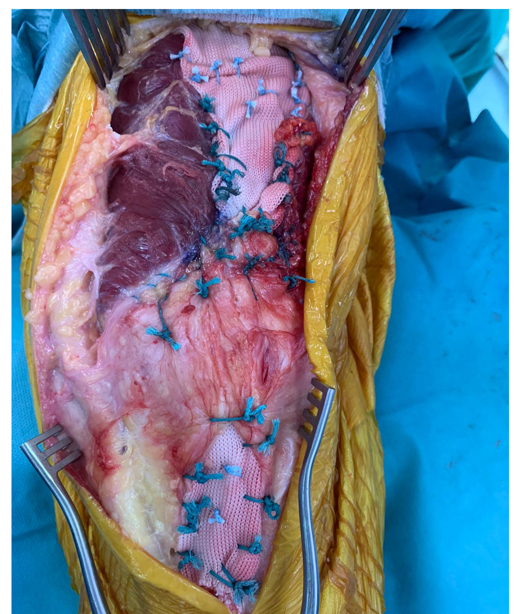
Reconstrucción de cuádriceps tras elongación V-Y y refuerzo con malla Mutars.