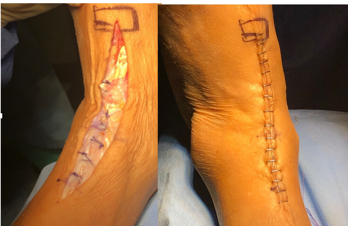
Fig 7 y 8. Cierre para evitar cuerda de arco y resultado final de la cirugía