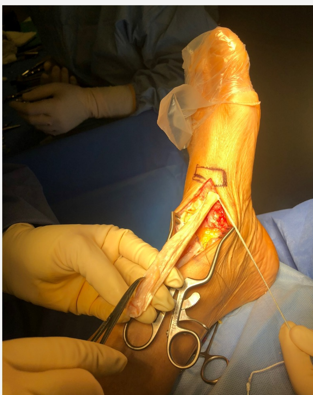
Fig 5. Introducción en cuña mediante sistema ToggleLoc