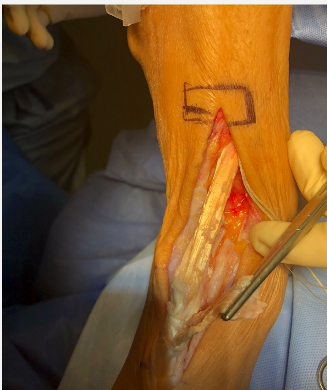
Fig 6. Sutura tipo pulvertaft al tendón nativo