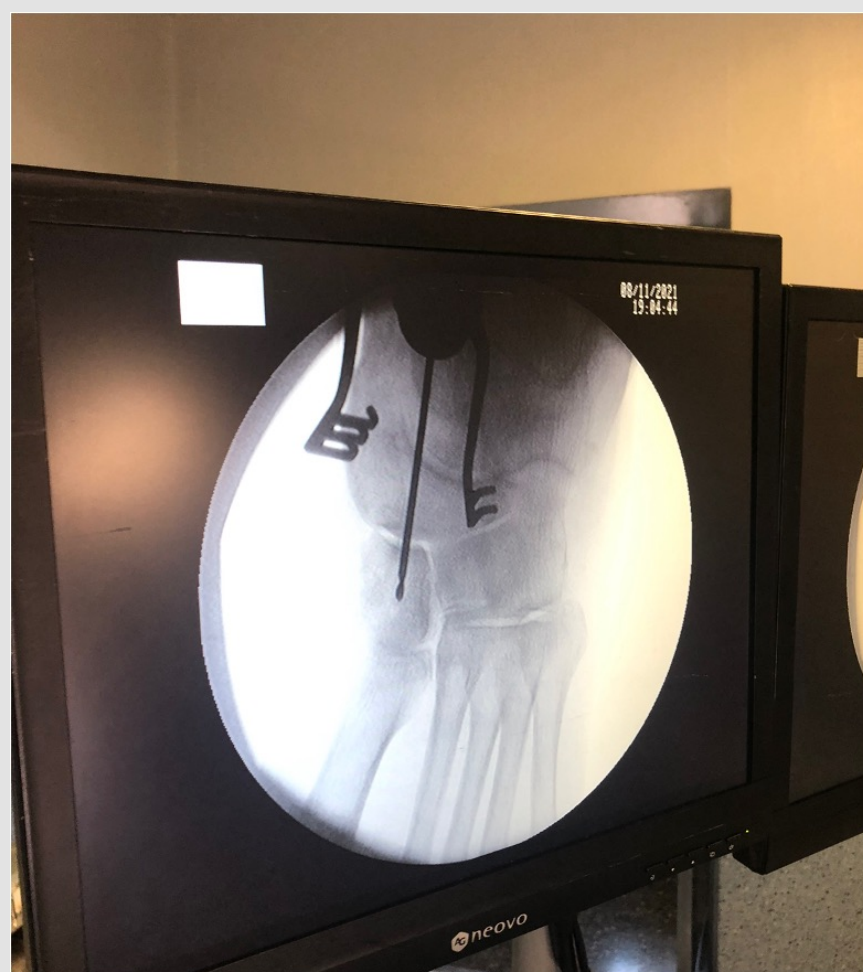
Fig 2. Localización de cuña mediante escopia