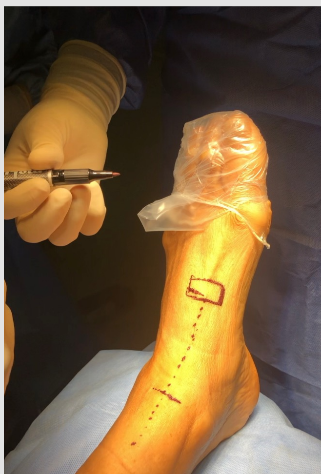
Fig 1. Incisión longitudinal 1cm lateral al tendón nativo