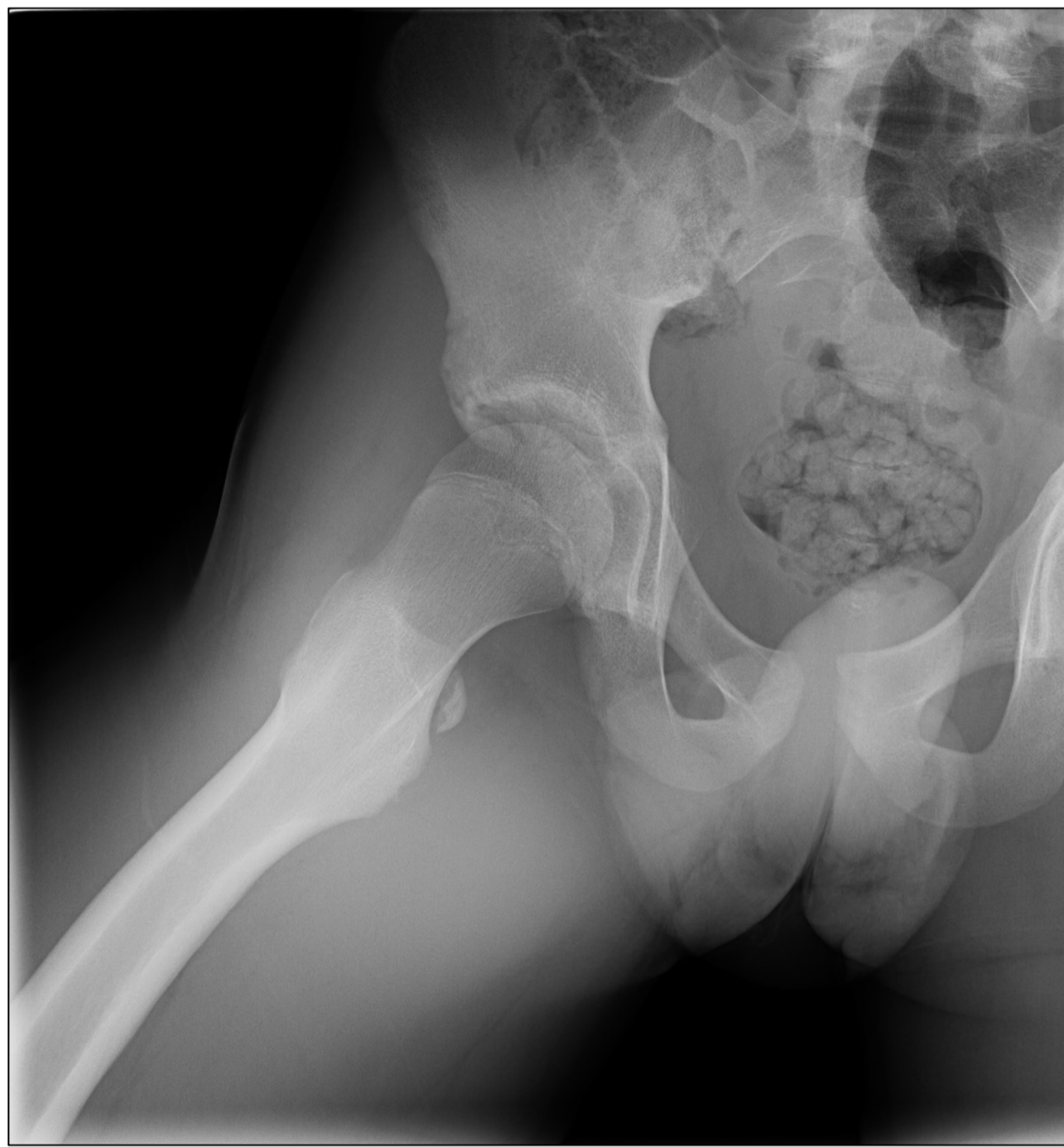
Figura 2. RX AXIAL CADERA.